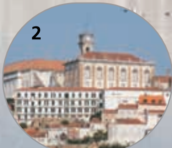
Universidade de Coimbra