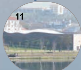
Pavilhão de Portugal