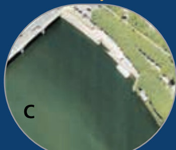
Cais de Embarque