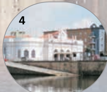
Estação de Caminho de Ferro