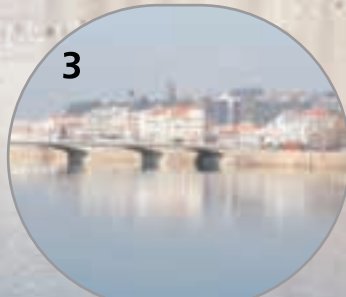
Ponte Santa Clara