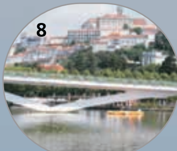
Ponte Pedro e Inês