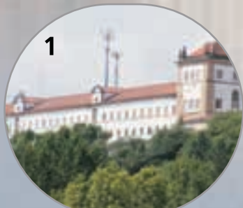
Convento Rainha Santa