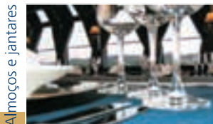
Almoços e jantares