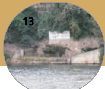
Lapa dos Esteios Quay