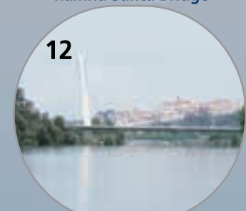
Ponte Rainha Santa